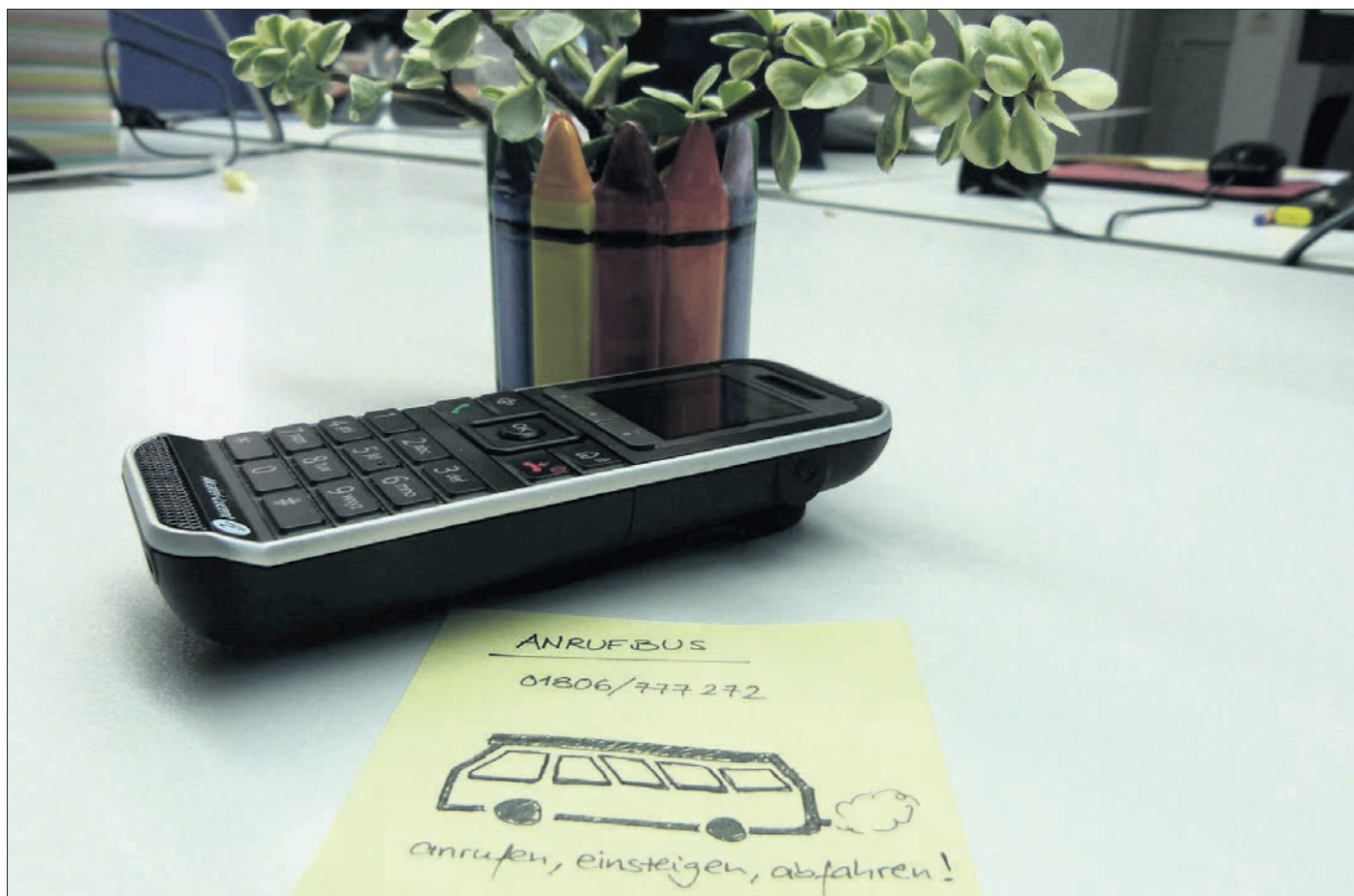
Der Anrufbus soll zukünftig auch am Wochenende und an den Feiertagen tagsüber im Stundentakt im Kreis unterwegs sein.

► Eine Bürgersprechstunde mit dem CDU-Landtagsabgeordneten Stefan Teufel wird am Montag, 30. Juni, von 14 bis 16 Uhr in seinem Bürgerbüro, Hohlegrabengasse 1, angeboten. Außerdem steht er unter Telefon 0741/41506 für Anliegen zur Verfügung.